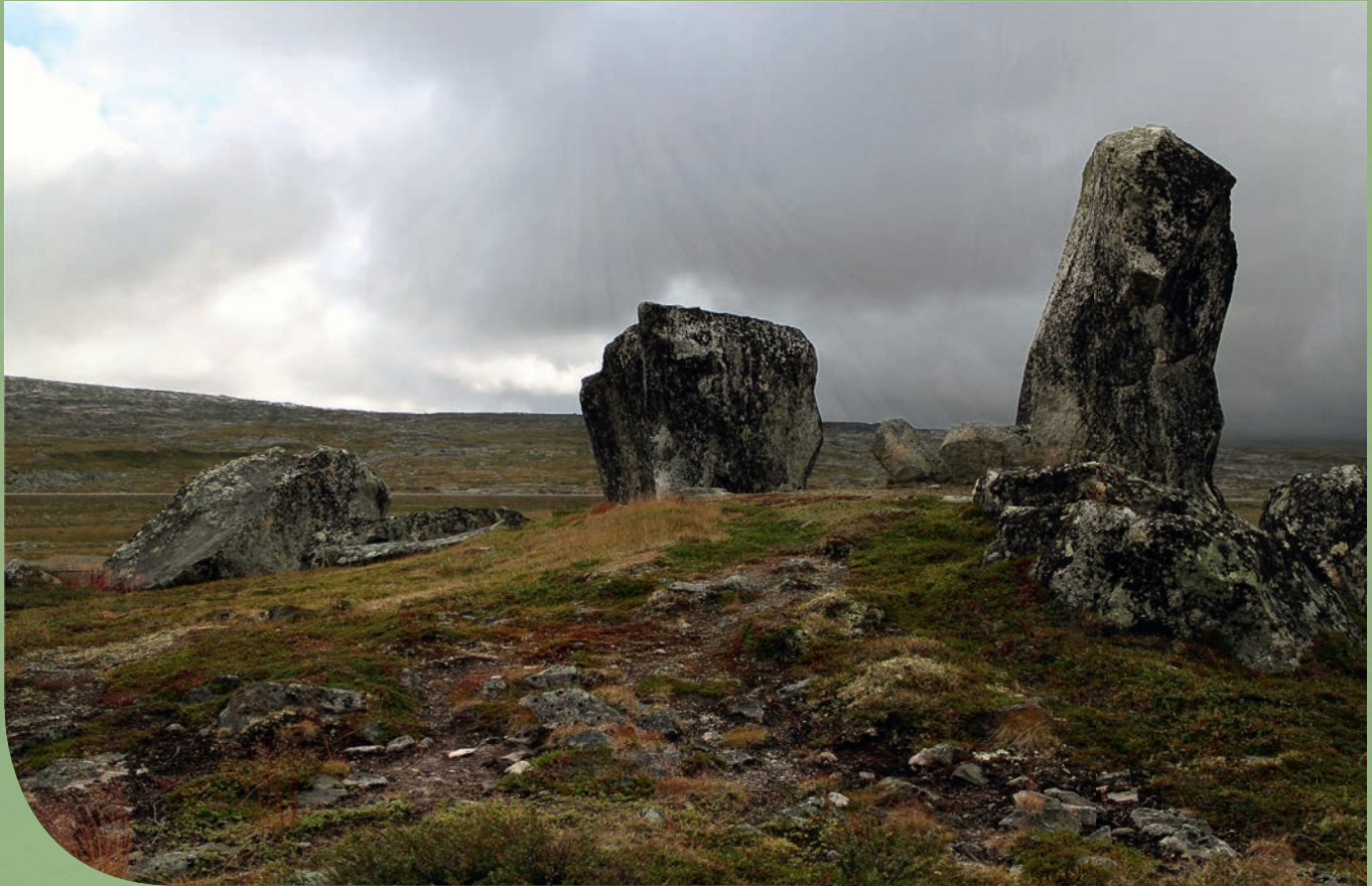
Offerstedet på Stødi.