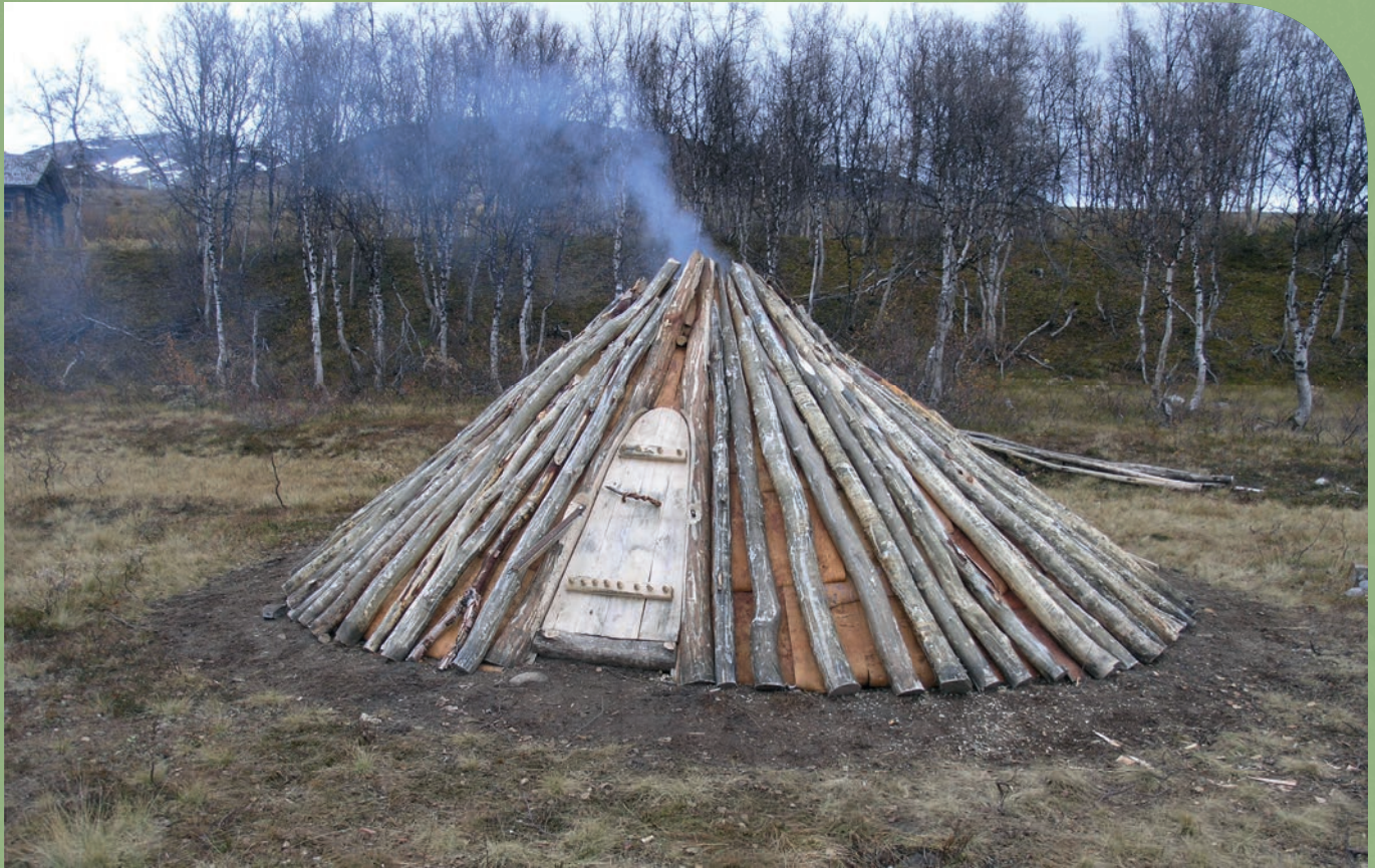
Silverbuseets forslag til hvordan et slikt hus kan ha sett ut.