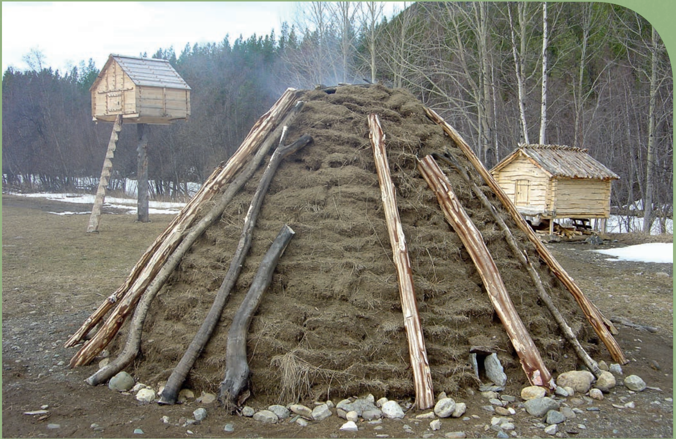
Gamme og stolpestabbur.